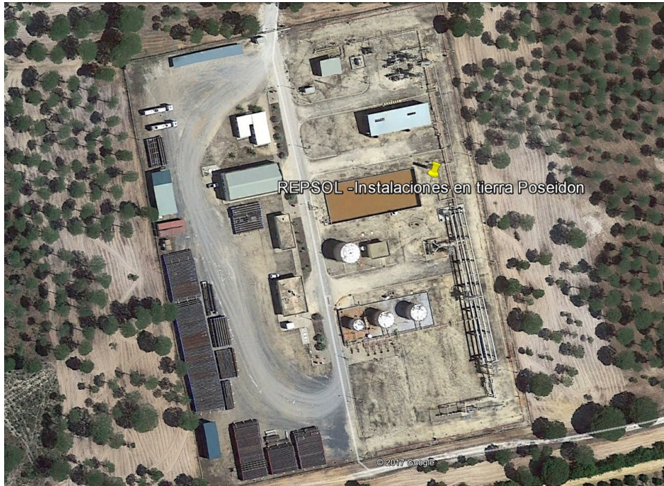
Planta de tratamiento del gas natural extraído de los pozos, excluida del proyecto de desmantelamiento

proyecto debe comprender una obra completa, susceptible de ser entregada al uso general, en este caso el disfrute de un medio ambiente devuelto a su condición original, no alterado.