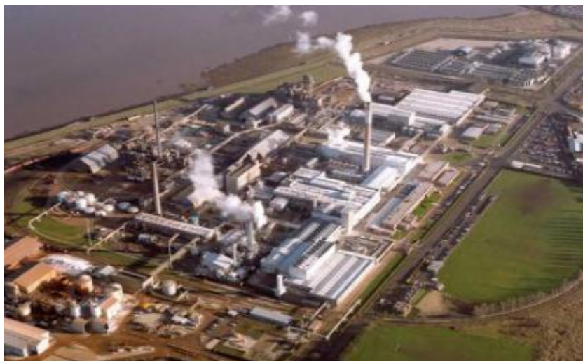
FÁBRICA DE TIOXIDE EN PALOS DE LA FRONTERA (HUELVA)

Durante varios años, la empresa TIOXIDE (actualmente TIOXIDE EUROPE S.L., del Grupo HUNTSMAN) ubicada en Palos de la Frontera, productora de colorantes y pigmentos, usando como materia prima Dióxido de Titanio (mineral ILMENITA importado desde Indonesia), se dedicó a transportar el residuo –catalogado como peligroso- y denominado ILMENITA INATACADA-, procedente del ataque con ácido sulfúrico sobre el citado mineral, a la Mina de Riotinto, vertiéndolo sin neutralizar y sin control ambiental alguno sobre una escombrera ubicada en las proximidades de Corta Atalaya, con vertiente a la cuenca del río Odiel, a la que se incorporan todos los lixiviados que emiten, algo completamente fuera del contexto de la actividad minera de la zona y sin justificación legal admisible. Es más, hay que situar esta cuenca en el contexto de futuro aprovechamiento de sus aguas para regadío mediante la construcción, ya en curso, de la Presa de La Alcolea (270 Hectómetros cúbicos) para la puesta en producción de 24.000 Has en la zona de El Condado, lo que incide doblemente en la obligada necesidad de eliminar esa fuente de contaminación completamente ajena a la tradicional actividad minera de la zona y que se encuentra injustificablemente depositada de forma descontrolada en la escombrera citada.