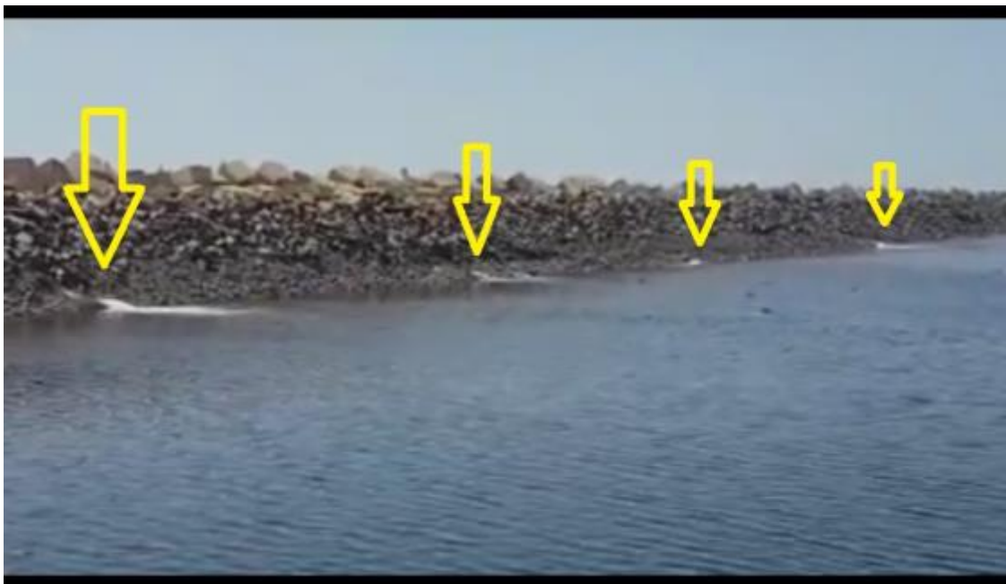
Filtraciones en la balsa 4 – fase 1 colgadas en redes sociales.

La respuesta dada por el Puerto ha sido la de cerrar el acceso a la balsa a viandantes, paseantes y pescadores deportivos que fueron expulsados de la zona para evitar testigos de su nefasta gestión de los dragados. Los pescadores deportivos se han manifestado por las calles de nuestra ciudad y han denunciado la mortandad de peces que ellos mismos descubrieron y colgaron en las redes sociales. Videos que han tenido hasta 800.000 reproducciones de ciudadanos cada vez más indignados.