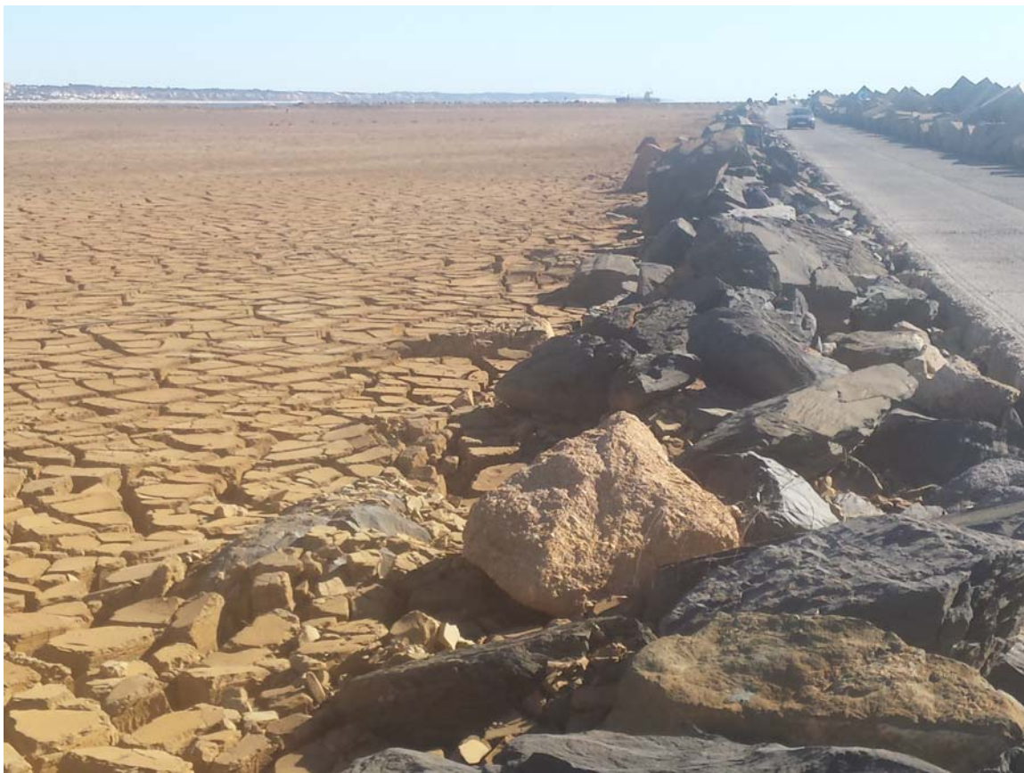
Balsa nº2 a nivel o cota de carretera.