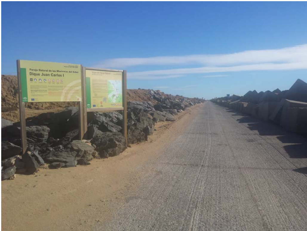
Recrecido Balsa 3 sobre el nivel de la carretera (LIC estuario del Tinto- Red Natura 2000). Véase el barro sobre la misma.