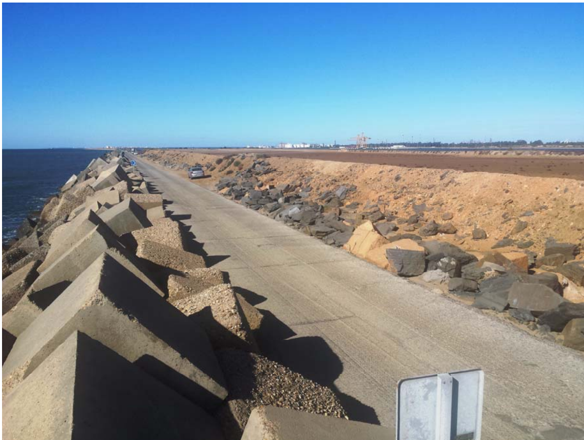
Véase el recrecido sobre el nivel de la carretera de la balsa nº3 dentro de Red Natura 2000.